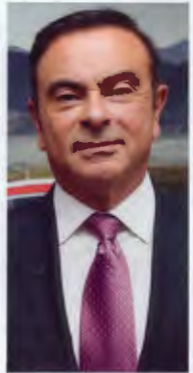
Carlos Ghosn, le P-DG de Renault, vise la deuxième place en Europe en 2016.

L'exercice mené avec les Allemands s'est révélé payant. Au départ, le niveau de qualité perçue du véhicule dérapait de 25% par rapport au système de notation de Daimler. A la fin, l'écart n'était plus que de 3%. Renault a retenu la leçon de ce partenariat. Toutes les futures voitures bénéficieront ainsi de l'expertise tirée des échanges avec la maison mère de Mercedes. Prenez la nouvelle Mégane, un modèle stratégique pour Renault, dont