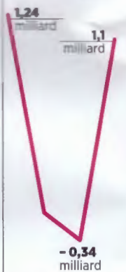
Evolution du résultat d'exploitation, en euros.